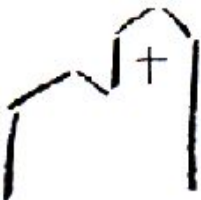
St. Nikolaus Niederhöchstadt