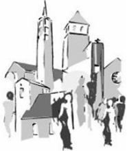
St. Marien und St. Katharina Bad Soden

Pfarreien im Pastoralen Raum Main-Taunus-Ost