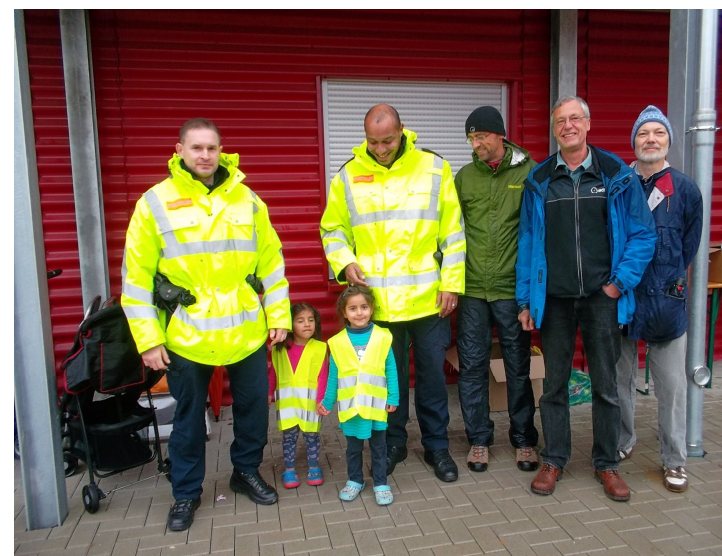
Die Stadtpolizei mit ehrenamtlichen Helfern und zwei Flüchtlingskindern in ihren Warnwesten.