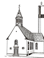
St. Pankratius Schwalbach