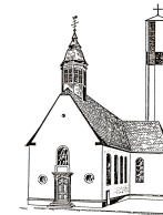
St. Pankratius Schwalbach