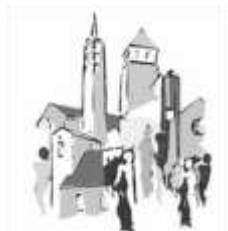
St. Marien und St. Katharina Bad Soden

Pfarreien im Pastoralen Raum Main-Taunus-Ost