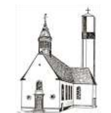
St. Pankratius Schwalbach

Sommer – Sonne – Urlaub – Ferien – Reisen – Feste – Fahrten – Aufbruch – Sehnsucht – Hektik – Länder – Menschen – Abenteuer und in Allem ein Gebet: