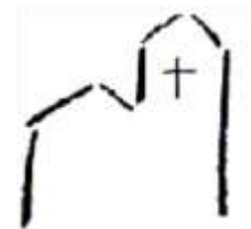
St. Nikolaus Niederhöchstadt