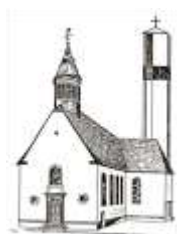
St. Pankratius Schwalbach

Kinder suchen sich gerne Identifikationsfiguren. In ihnen finden sie das wieder, was sie werden wollen, wie sie sein möchten, was ihre Entwicklung widerspiegelt oder auch das, was ihnen in ihrem Leben momentan fehlt.